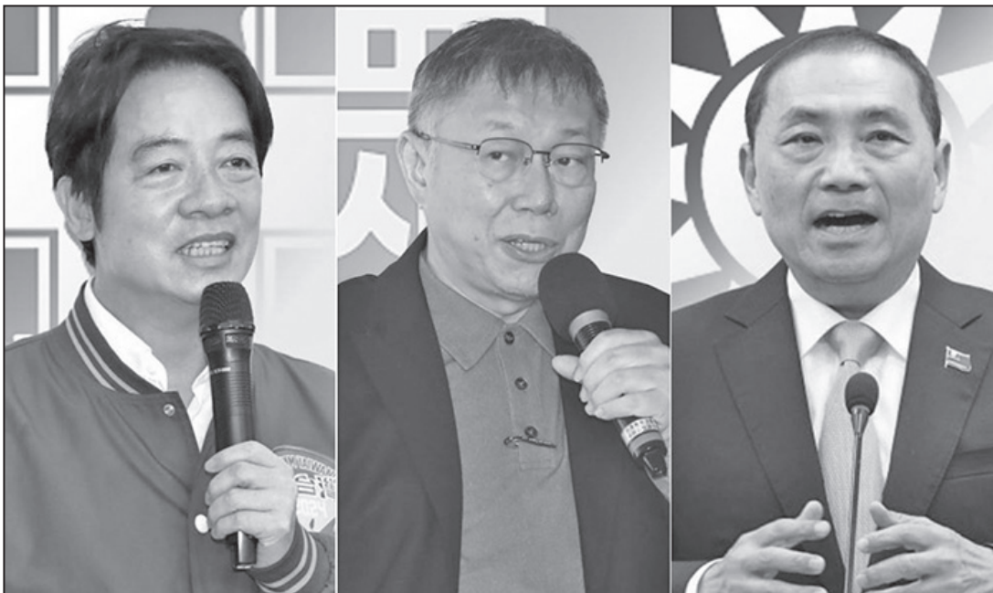
左起為2024總統參選人賴清德、柯文哲、侯友宜。