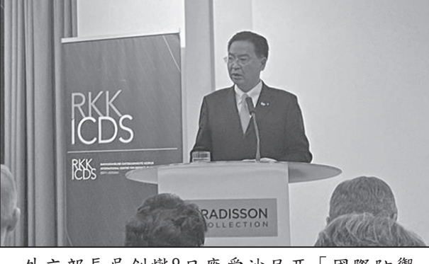
外交部長吳釗燮8日應愛沙尼亞「國際防禦及安全中心」(ICDS) 邀請發表專題演說。

吳釗燮提及，台灣為歐盟重要貿易夥伴，也在全球供應鏈中扮演重要角色。如果台海發生衝突，將對全球經濟造成嚴重衝擊；因此國際社會持續關注台海現況，有助降低中國對台動武的可能。台灣除提升自我防衛能力的決心，也將與美國等夥伴合作，並學習波羅的海國家持續發展不對稱戰略能力。他重申，在蔡英文總統的領導下，台灣不挑釁、不冒進，但也不會屈服於中國