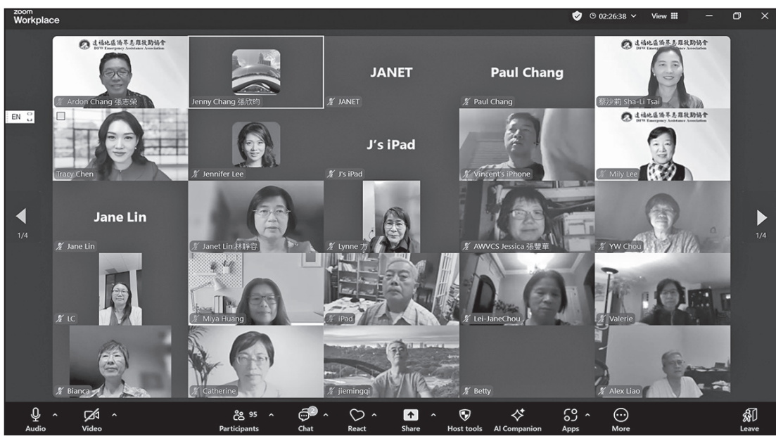
參加會議部份來賓大合照