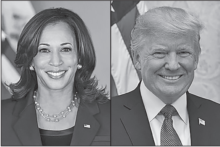
民主黨的賀錦麗（左）與共和黨的特朗普將角逐總統寶座。

隨著全美各地提前投票陸續展開，接下來的11月，美國選民將會通過手上的選票選出下一任美國總統，這場選戰受到全球的密切關注。選民還將投票選出國會議員，而這些議員在立法通過對美國人生活產生重大影響的法律方面，起著關鍵作用。