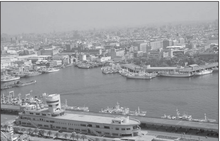
前鎮漁港是遠東最具規模的遠洋漁業中心，台灣遠洋漁業排名世界前3，年產值將近新台幣300億元。

(本報訊)高雄市前鎮漁港改建，耗資前瞻預算81億元引發熱議，如今更被挖出，經費從最初的3000萬元，暴增了270倍，過程中發生甚麼事？現任高雄市長陳其邁就表示，整個計畫在前市長韓國瑜任內就已經確定了，2019年韓市府提出3千萬元的需求，同年時任行政院長蘇貞昌視察，雖然韓國瑜沒有出，但當場也就宣布經費增加到13億元，隔年韓國瑜遭到罷免，陳其邁補選上市長，就任的隔天，蘇貞昌就親自跑一趟漁港，宣布加碼到59.1億元，今年初更把預算拉高到81億元，面對在野黨質疑經費的合理性，行政院副院長鄭文燦也回應，不要用台北看天下。 高雄市長陳其邁說：「對地方稍微了解的人，都知道這個(前鎮)漁港改建迫在眉睫，當時的市長是韓國瑜市長。」任何對地方有點了解，都知道前鎮漁港改建迫在眉睫，整建計畫是韓國瑜擔任市長時提出，高雄前鎮漁