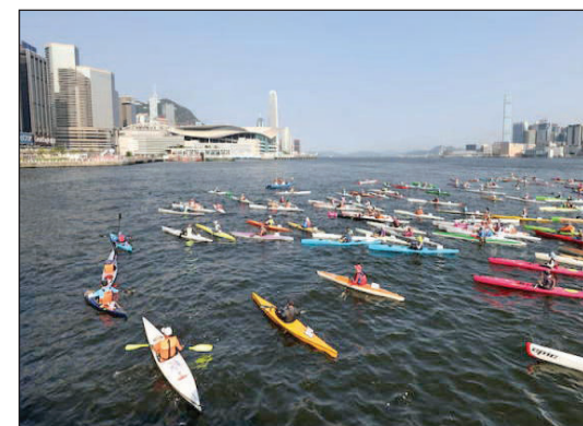
▲維港首次上演獨木舟水球賽

木舟(無舵)/海洋獨木舟15公裏長途賽、立劃板長途賽(2公裏)、獨木舟(無舵)短途繞標賽及立劃板繞標賽(約400米)等個人賽事。