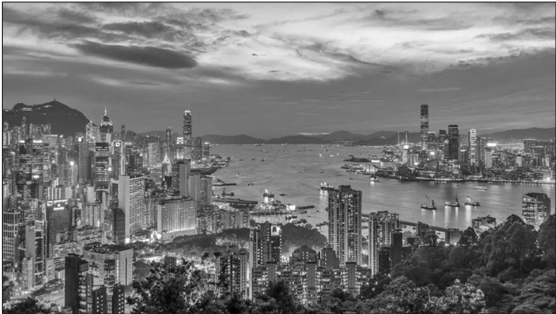
有「東方之珠」美譽的香港。