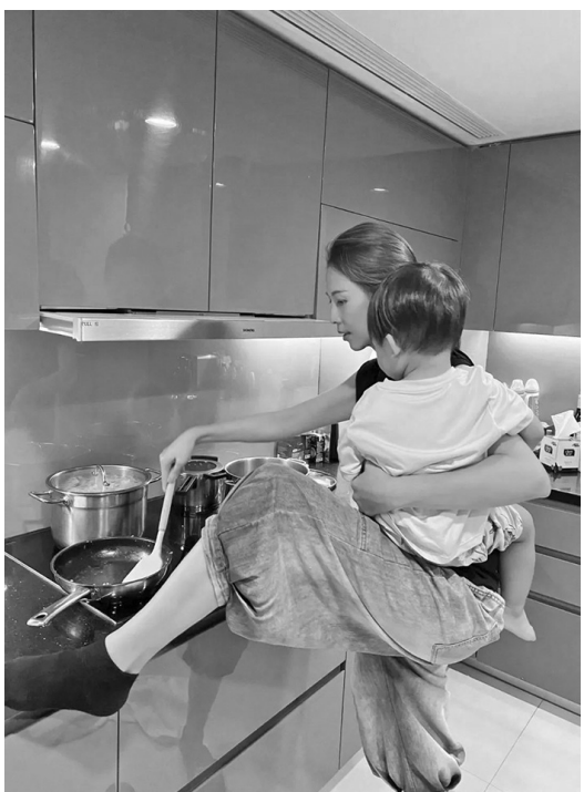
可列入高檔的廚房設備。

而且她也沒有誇張，這個僅有80平的小公寓，對很多生活在香港的人來說，是一輩子都無法企及的夢想。