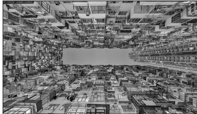
寸金尺土的香港還有不少「籠屋」。

棺材房的產生是因為橫向空間已經無法再次切割，所以只能縱向分離，這裡的房間每間平均面積僅有1.5m²。沒錯就是這個還沒有雙人床大的空間，一個月的租金就要1500元~2000元左右。