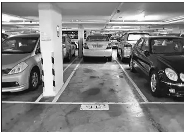
這是一個標準的停車位。