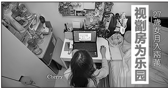
劏房也可包羅萬有。

在這裡，個子稍微高一點的人腿都無法伸直，出門進門都要「卑躬屈膝」，是不是像極了棺材生活。