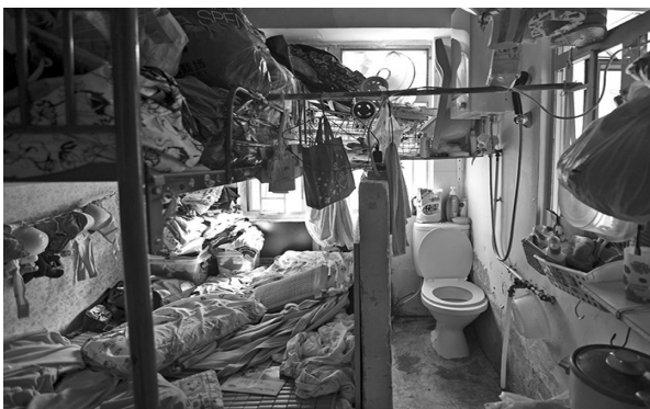
有透光窗戶並附設馬桶和淋浴的被視為「高級」劏房。