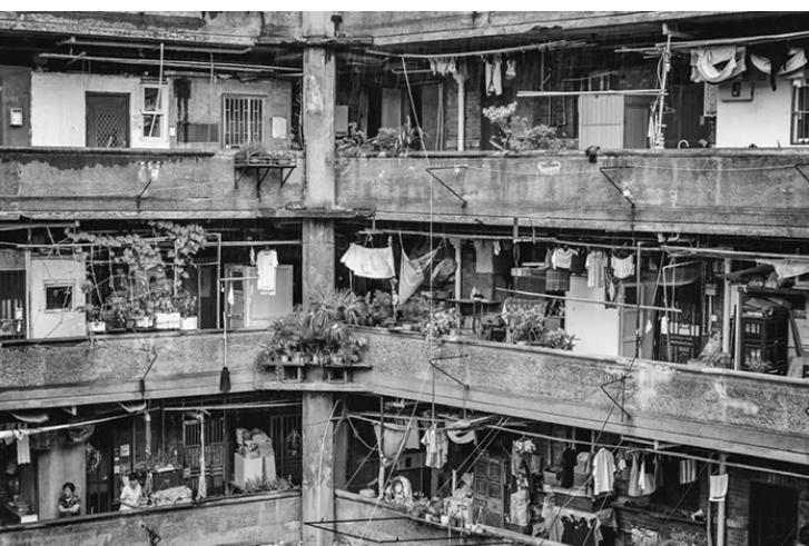
豬籠城寨式的公寓走廊。

很多網友說：那畫面光是想一想，都能讓人喘不過氣。可這令人窒息的房子，阿櫻已經住了3年了，甚至還很滿足。因為在香港，很多人連這8m²都沒有。