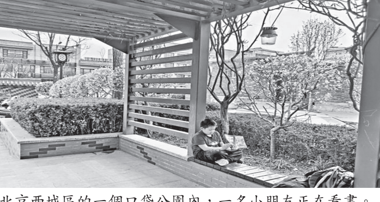
北京西城區的一個口袋公園內，一名小朋友正在看書。

空間不斷拓展，首都市民開窗見綠、出門進園的美好願景已成為現實。2024年北京計劃新增造林綠化1萬畝，新建公園綠地200公頃，全市森林覆蓋率將達44.95%，再添15處休閒公園和城市森林，50處口袋公園及小微綠地，公園綠地500米服務半徑覆蓋率達到91%。 拓綠色空間 建百條「城市畫廊」 此外，北京還將通過對二、三、四、五環及其他城市重要聯絡線上的300座立交橋進行垂直綠化，拓展城市綠色空間。充分利用道路周邊現狀圍欄、牆體，通過垂直綠化和彩化建設，打造100條美麗的「城市畫廊」，努力實現「老百姓走出來就像在自己家花園一樣」的期望。