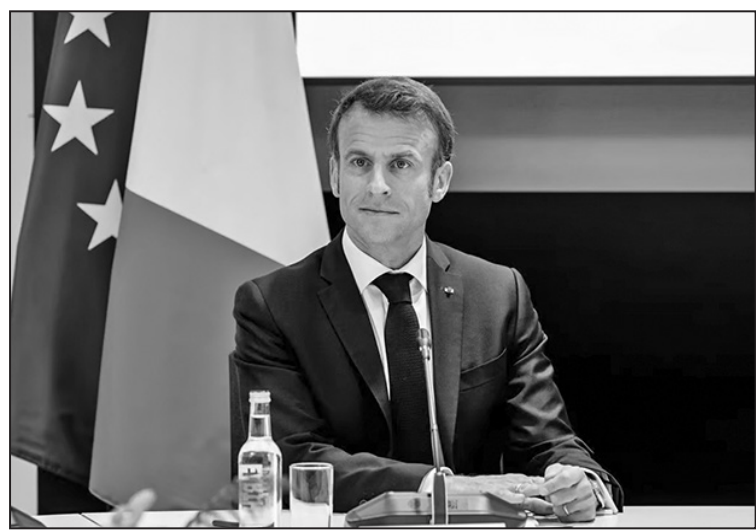
馬克宏接受政治新聞網站Politico專訪時表明台灣安全不關歐洲的事。

「戰略自主」顯得挑釁，特別是美國即將邁入大選年，共和黨對花大錢援助烏克蘭日漸不滿的此刻。