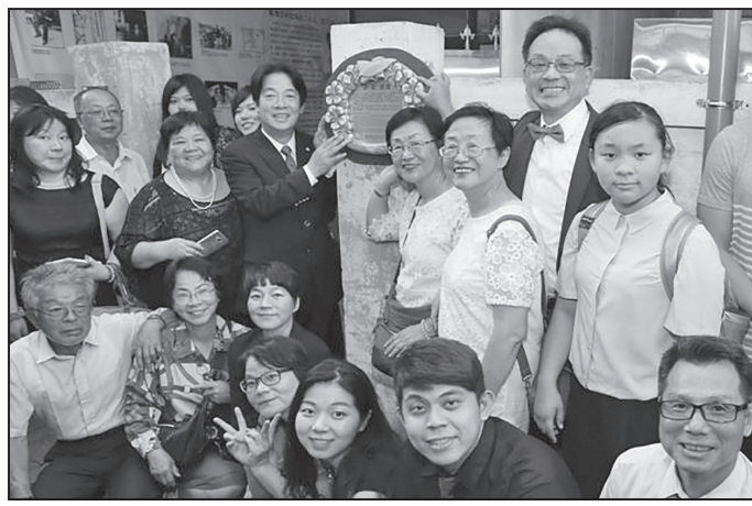
時任臺南市市長的臺灣總統當選人賴清德在許石故居家前和他的子女合照。