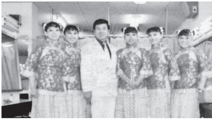
「許氏中國民謠合唱團」父女合照