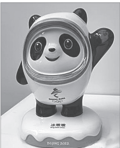
冰墩墩瓷雕作品高24厘米，代表北京成功舉辦第24屆冬奧會。

北京冬奧組委會曾預計，冬奧會的熱度不會隨著比賽結束而下降，冬奧會特許商品的銷售期將持續到6月底。