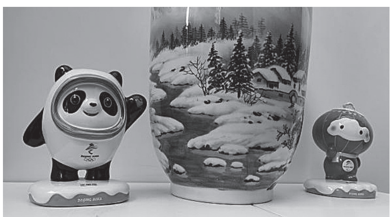
3月8日，新品陶瓷冰墩墩、雪容融亮相京城。

2022年北京冬殘奧會賽事正激烈進行，冬奧會和冬殘奧會特許商品銷售熱度不減，冰墩墩等依舊受熱捧。3月8日，新品陶瓷冰墩墩、雪容融在北京首發亮相，引發新一波關注。