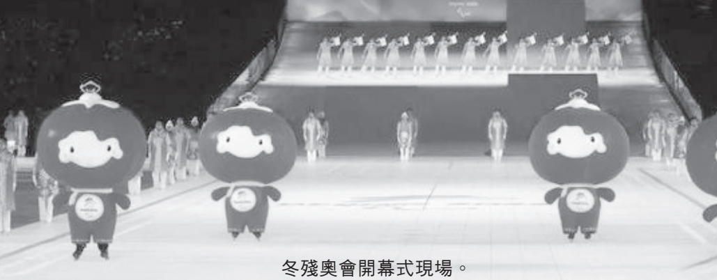
冬殘奧會開幕式現場。

距離北京冬奧會閉幕不到半月，璀璨的煙花再次點亮“鳥巢”上空，來自世界各國和地區的殘疾人運動員在殘奧精神的感召下匯聚北京，共迎這一代表著拼搏、自強不息和團結友誼的冰雪盛會。