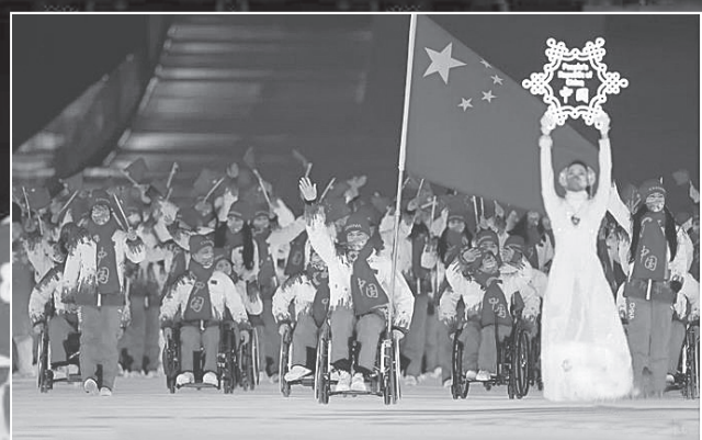
他們是中國代表團旗手。