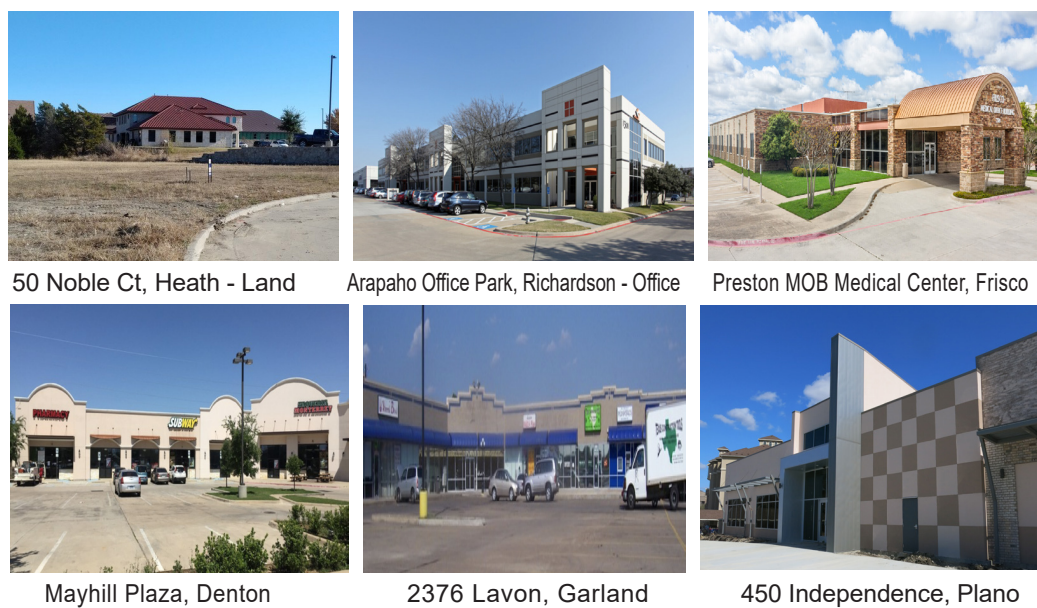
39 Acres Denison 86.64 Acres Celina 0.732 Acres Plano 50 Noble Ct, Heath - Land Arapaho Office Park, Richardson - Office Preston MOB Medical Center, Frisco Mayhill Plaza, Denton 2376 Lavon, Garland 450 Independence, Plano