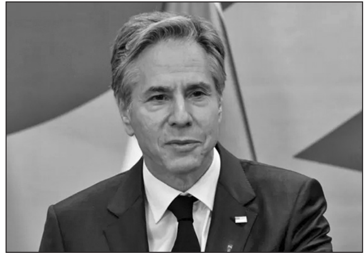
美國國務卿布林肯原本預計將於2月5日至6日訪問中國。