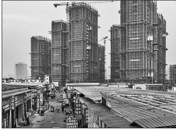
合肥的一個住宅開發項目，攝於去年。

中國的買房者們曾堅定地相信房子是最安全的投資，這種信念曾推動該國房地產行業成為經濟的支柱。但在過去的兩年裡，隨著房地產商們在巨額債務的重壓下崩盤，新房銷售驟降，中國的消費者們已展現出一種同樣不可動搖的信念：房子已成為賠錢的投資。