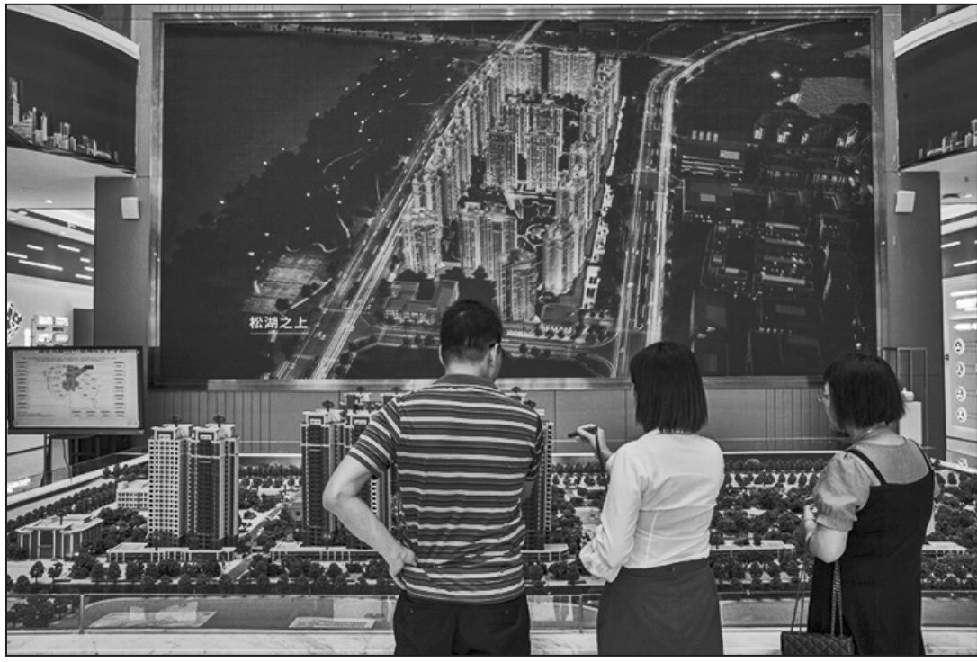
恆大的展廳，攝於2021年。據估計，中國有2000萬套已付款但尚未交付的公寓。

許多中國家庭財產的主要部分是房子，對房地產的信心快速喪失是中國決策者們面臨的一個日益嚴重的問題，他們正在竭盡全力重振這個陷入困境的行業，但收效甚微。香港一家法院週一下令負債逾兩萬億元的中國恒大停盤進入清算過程，這家公司的問題充分暴露了中國房地產行業的困境。